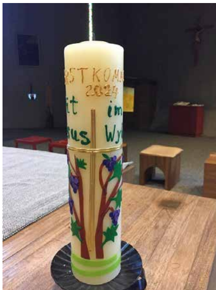
Klassenkerzen der beiden 3. Klassen des Schulhauses Sonnenhügel und Gutenbrunnen