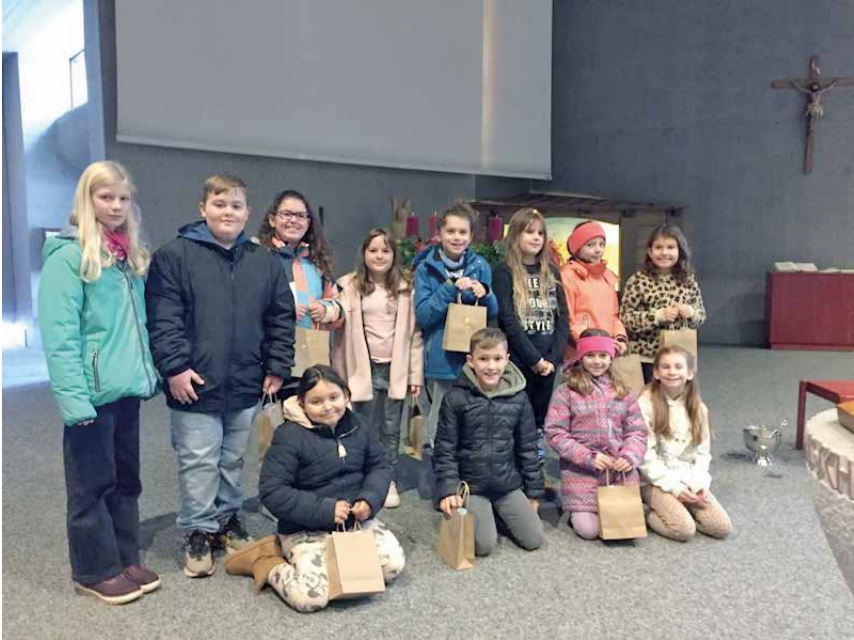
Gruppenfoto der Erstkommunionkinder