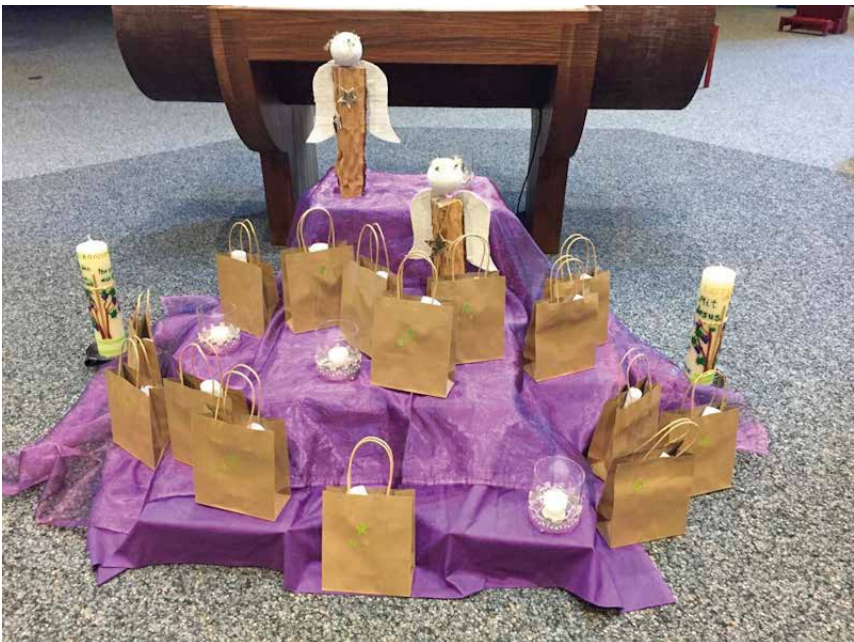
Schutzengeltaschen mit den Briefen zur Gebetspatenschaft