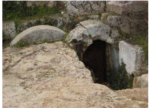
Felsengrab Jerusalem