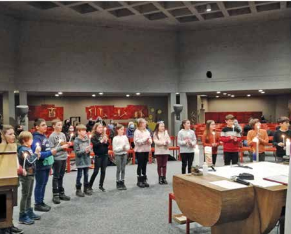
Versöhnungsgottesdienst der 4. bis 6. Klassen mit Feuer-Ritual