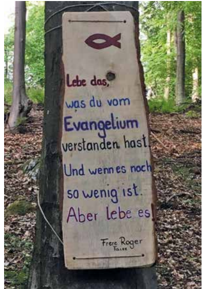
Stele aus dem «Auferstehungsweg» der Pfarrei St. Ansgar, Rendsburg