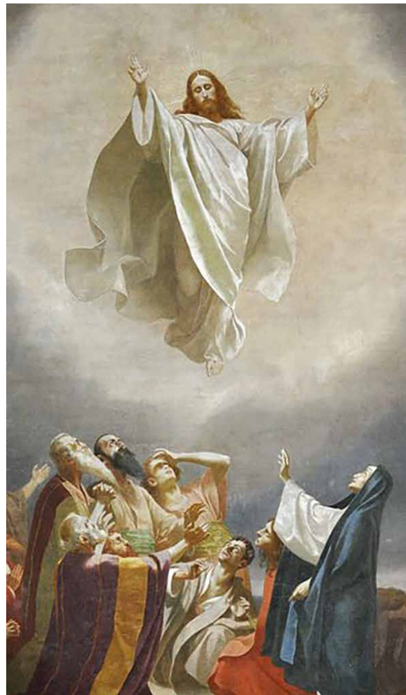
Pfarrkirche Oberschach, «Christi Himmelfahrt»