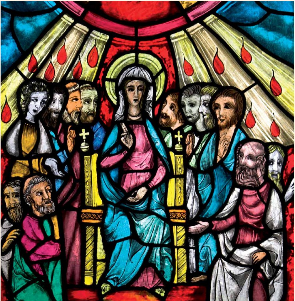
Pfingsten am 23. Mai, mit Maria, Patronin des Monat Mai