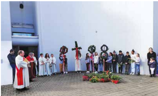
Segnung der Palmzweige und Bäume