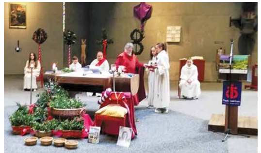
Palmzweige in Körben vor dem Altar