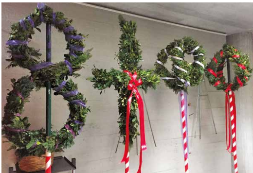
Palmbäume wurden mithilfe der 5. + 6. Klassen und Eltern am Mittwoch vor dem Palmsonntag gebunden