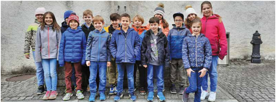
Gruppenfoto der Erstkommunionkinder

Ausflug am 29. März: Besuch in der Hostienbäckerei im Kloster Maria Zuflucht in Weesen.