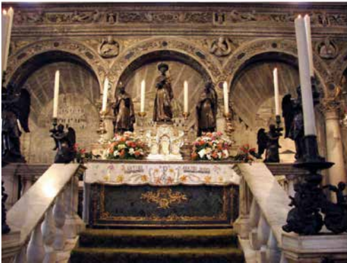
Grab des Hl. Antonius in Padua

«Klein ist der Mensch, der Vergängliches sucht; gross aber, wer das Ewige im Sinn hat.»