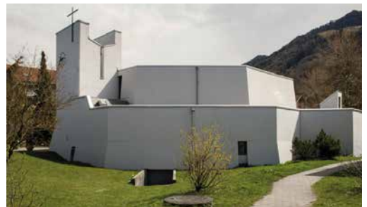
Seitenansicht, Kirche St. Josef, Buttikon

«Kommt alle zu mir! Ich werde euch Ruhe verschaffen.» – spricht der Herr. Es gibt so viele und wunderschöne Ferienorte auf dieser Erde, wo sich Körper und Geist erholen, wo man die Ruhe geniessen kann. Auch Jesus lädt uns in seinen Ferienort ein, um zur Ruhe zu kommen. Das ist unser Gotteshaus, die Kirche, wo wir Ruhe finden, wo wir auftanken und neue Kraft schöpfen können für Seele und Leib. Hier ist auch der Ort, wo wir Christus in besonderer Weise begegnen.