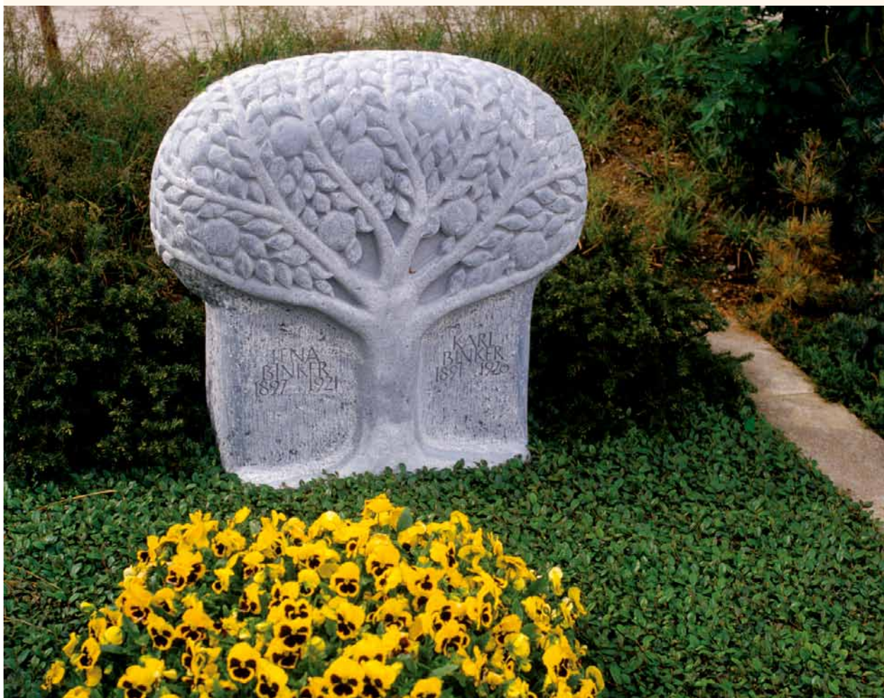
Baum des Lebens als hoffnungsfroher Grabstein