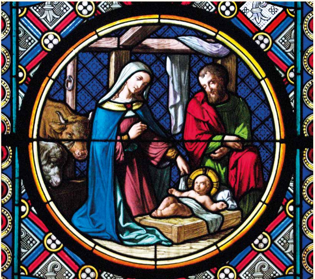
Geburt Christi, Glasfenster (19. Jhdt.) im Chor des Münsters zu Basel