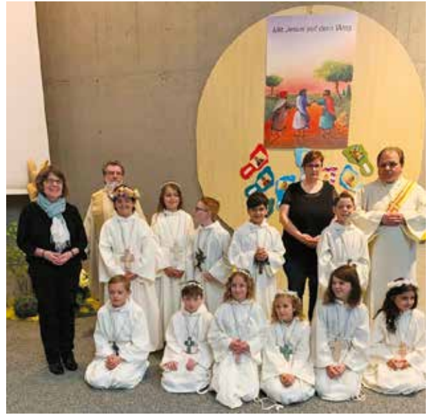
Gruppenfoto der Erstkommunionkinder mit Jahresmotto «Mit Jesus auf dem Weg»...