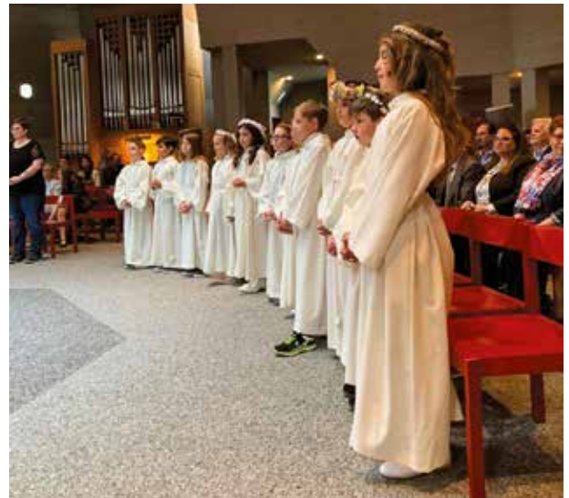
Erstkommunionkinder in gespannter Erwartung...