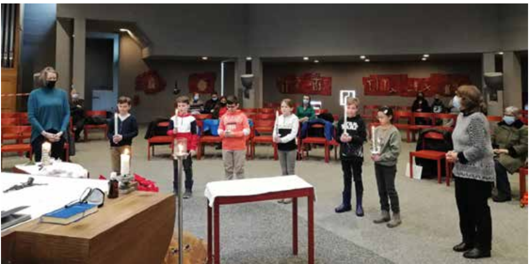
Erstkommunionkinder – 2. Gruppe mit Katechetinnen (17.01.)

Zu guter Letzt: Beachten Sie bitte, dass sich die Öffnungszeiten des Sekretariats geändert haben: Neu montags von 8.00 Uhr bis 12.00 Uhr!