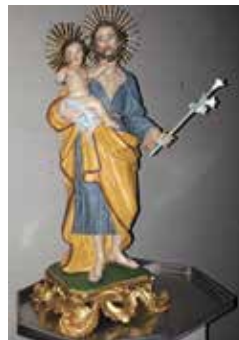
St. Josefsstatue, Buttikon

So empfehlen wir unsere Pfarrei in diesem Jahr besonders dem Hl. Josef und rufen ihn an im folgenden Gebet: