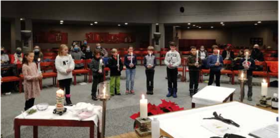
Erstkommunionkinder – 1. Gruppe (16.01.)